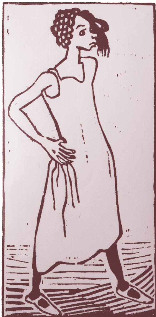
Otto Pankok, Hilda , Holzschnitt 1942

„Gott ist dein Trotz.“ In neueren Bibel-Übersetzungen steht nicht mehr Trotz, sondern Zuflucht oder Zuversicht. Auch gut, diese Drei: Der Herr ist dein Trotz, deine Zuflucht, deine Zuversicht.